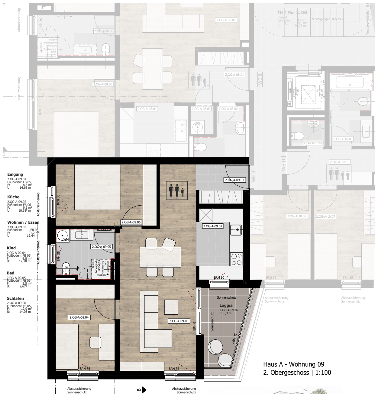
Haus A - Wohnung 09 2. Obergeschoss | 1:100